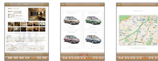
ホテル・旅館編 交通機関編 観光地編

業種・業態・ご要望に合わせてアプリをカスタマイズ 小売店、ホテル・旅館、飲食店、観光地、交通機関、遊戯施設など、貴社の業種・業態に合わせてアプリをカスタマイズ致します。商品のアピールだけではなく、接客対応、危機管理対応マニュアル、クレームの対応、社内研修やスタッフの教育ツールとしてなど、さまざまなシーンで活躍します。